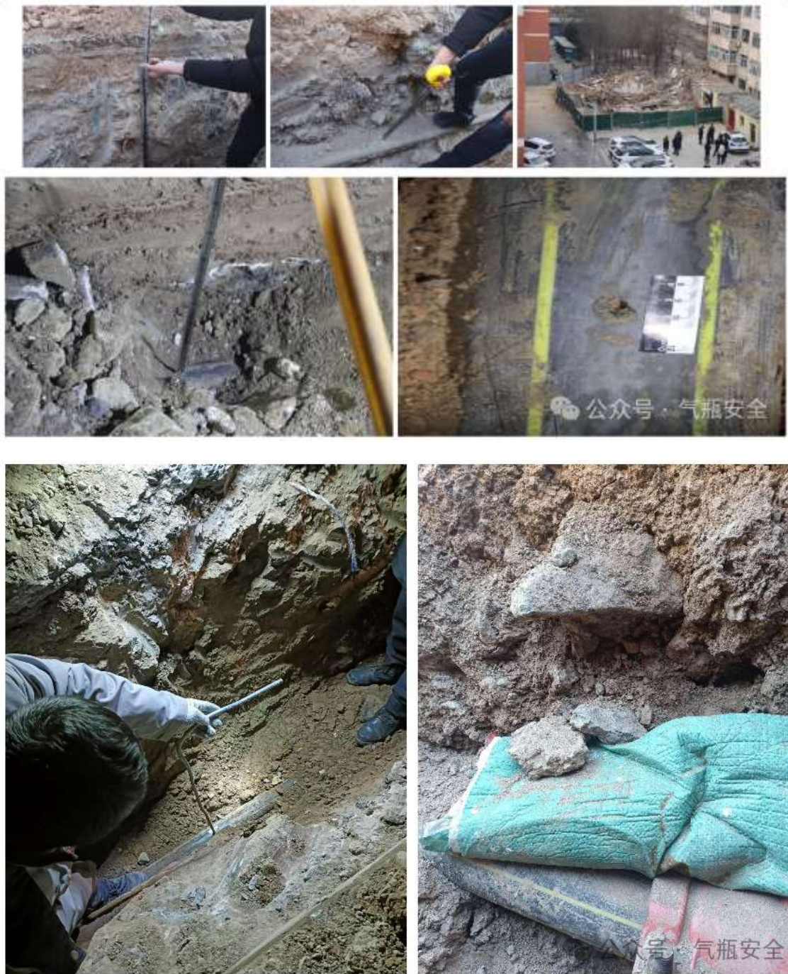
图四 管道埋深、回填、破损泄漏点、爆炸后情况