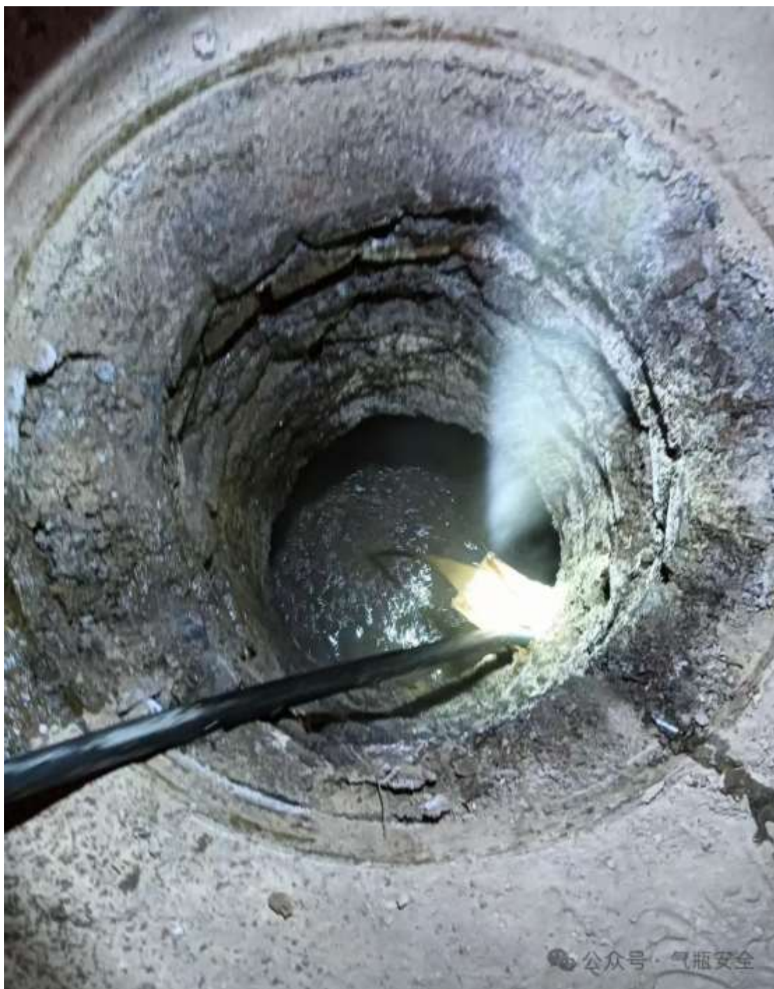
图三 管道泄漏点及沥青路面、混凝土硬化停车场、污水井情况